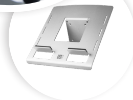
R-GO MORELIA LAPTOPHOUDER