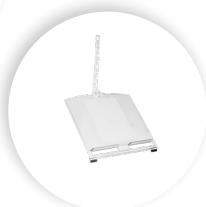
R-GO MORELIA DOCUMENTHOUDER