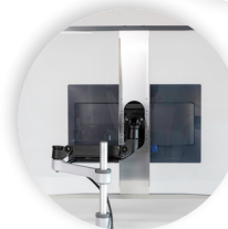
R-GO HYGIËNISCH VEILIGHEIDSSCHERM