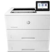
HP LaserJet Enterprise M507x

Deze printer is ontworpen om alleen te werken met cartridges die een nieuwe of hergebruikte HP-chip hebben. De printer gebruikt dynamische beveiligingsmaatregelen om cartridges te blokkeren die een chip hebben die niet van HP is. Periodieke firmware-updates behouden de effectiviteit van deze maatregelen en blokkeren cartridges die eerder wel werkten. Met een hergebruikte HP-chip kunt u hergebruikte, gerecyclede en opnieuw gevulde cartridges gebruiken. Meer informatie vindt u op: http://www.hp.com/learn/ds