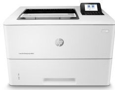
HP LaserJet Enterprise M507dn

Kies een HP LaserJet Enterprise printer die is ontworpen om veilig en efficiënt om te gaan met bedrijfsoplossingen, en die helpt duurzamer te werken met HP EcoSmart zwarte toner. Kies voor een printer die aan uw zakelijke behoeften voldoet en waarop u kunt vertrouwen. 1