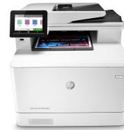
HP Color LaserJet Pro M479fnw

Deze printer is ontworpen om alleen te werken met cartridges die een nieuwe of hergebruikte HP-chip hebben. De printer gebruikt dynamische beveiligingsmaatregelen om cartridges te blokkeren die een chip hebben die niet van HP is. Periodieke firmware-updates behouden de effectiviteit van deze maatregelen en blokkeren cartridges die eerder wel werkten. Met een hergebruikte HP-chip kunt u hergebruikte, gerecyclede en opnieuw gevulde cartridges gebruiken. Meer informatie vindt u op: http://www.hp.com/learn/ds