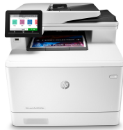
HP Color LaserJet Pro M479dw

Winnen in het bedrijfsleven betekent slimmer werken. De HP Color LaserJet Pro MFP M479 is ontworpen om u te laten focussen op de meest effectieve manier om uw bedrijf te laten groeien en de concurrentie voor te blijven.