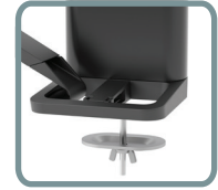
DOORVOER 98-492-009 (MATZWART)