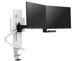
Dubbel met standaardklem