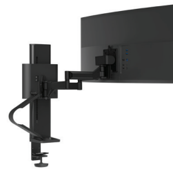
Enkel met standaardklem